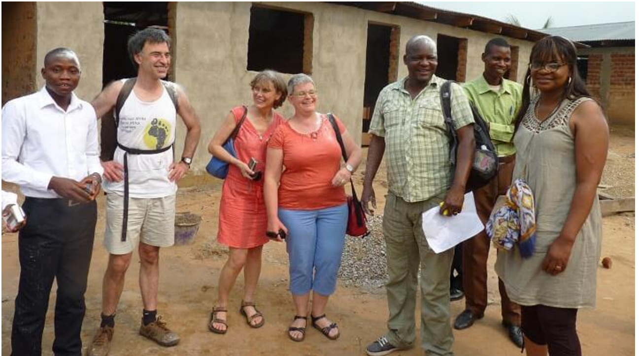
Aankomst in de school in Lodja, vier jaar geleden

In een volgende nieuwsbrief zullen we jullie uitgebreid informeren met verhalen en foto's!