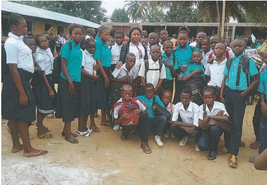
Meisjes en jongens in de school

Ekimanyelo vzw zet in op de Sustainable Development Goals van de Verenigde Naties 2015-2030 waaronder gendergelijkheid. Meer in het bijzonder streeft het Complexe Scolaire d'Excellence in Lodja ernaar zoveel mogelijk meisjes naar de school krijgen, ook in het secundair onderwijs. Onderwijs vergroot immers hun rol binnen de gemeenschap en helpt de armoede terugdringen. Op 5 jaar tijd is het aantal meisjes in het Complexe Scolaire toegenomen van 250 naar 510 (op een totaal van 1500 leerlingen). Een mooi resultaat! Niettemin is een blijvende inspanning nodig om gendergelijkheid helemaal te realiseren.