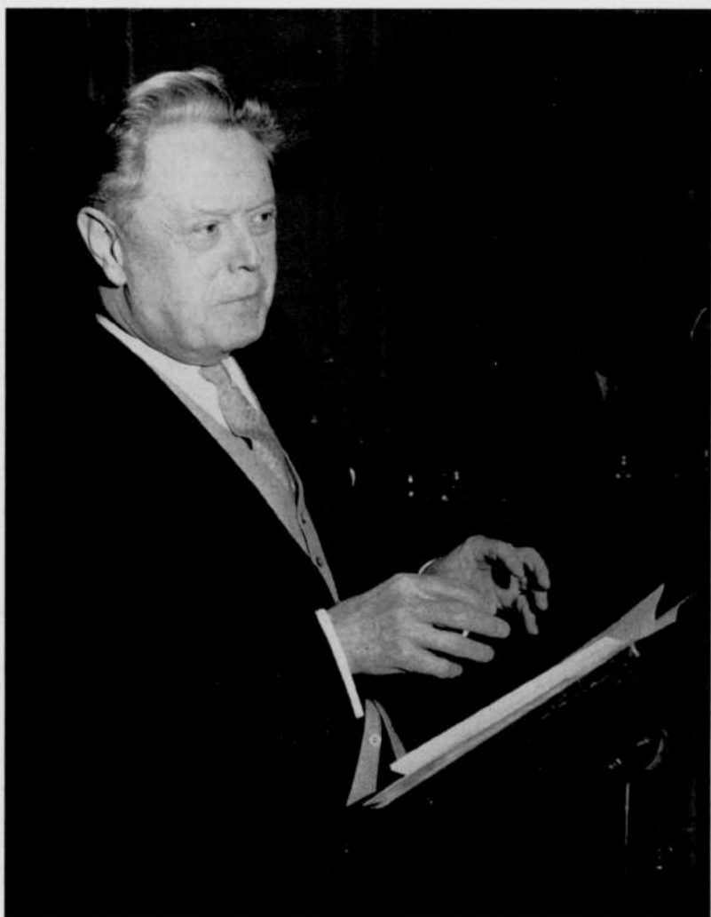
Baron Joseph Albert DE VLEESCHAUWER (1 januari 1897 — 24 februari 1971)