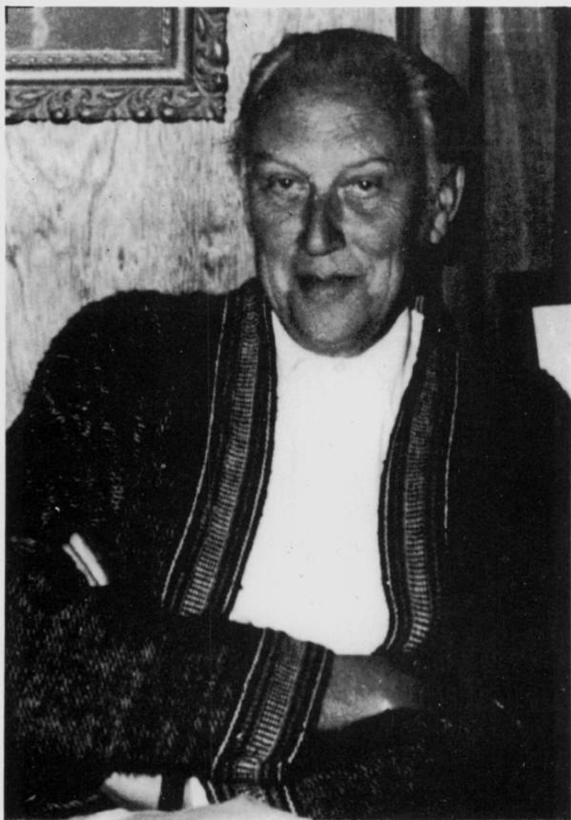
Louis VAN DEN BERGHE (Gand, 29 octobre 1906 - Johannesburg, 3 janvier 1979)