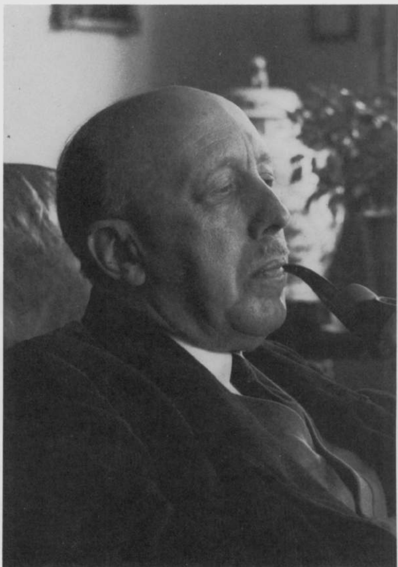
Gaston-François DE WITTE (Anvers, 12 juin 1897 - Bruxelles, 1 juin 1980)