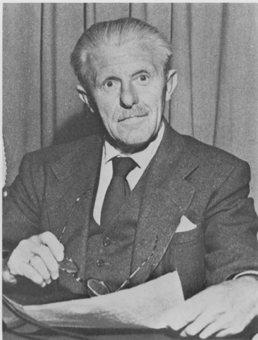
Fernand VANLANGENHOVE (Mouscron, 30 juin 1889 - Bruxelles, 29 juillet 1982)