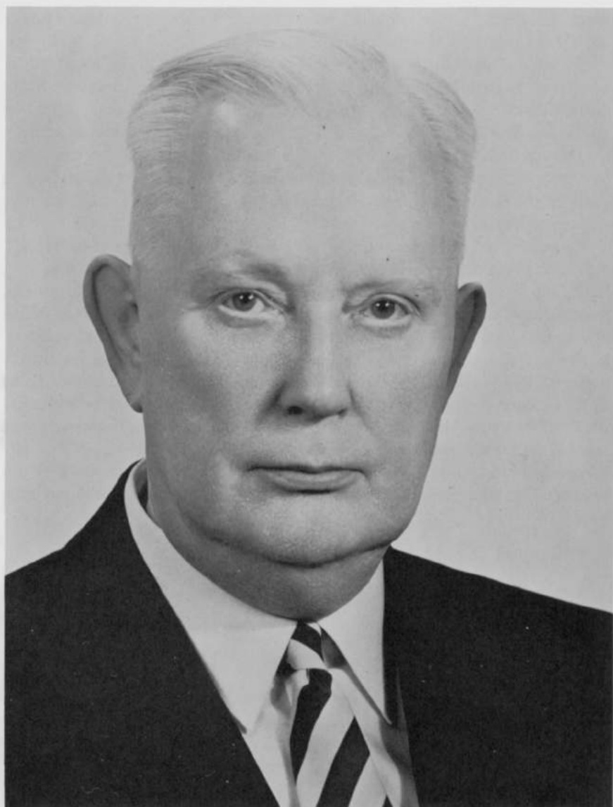
Thure Georg SAHAMA (Viipuri, Finlande, 14 octobre 1910 - Helsinki, 8 mars 1983)