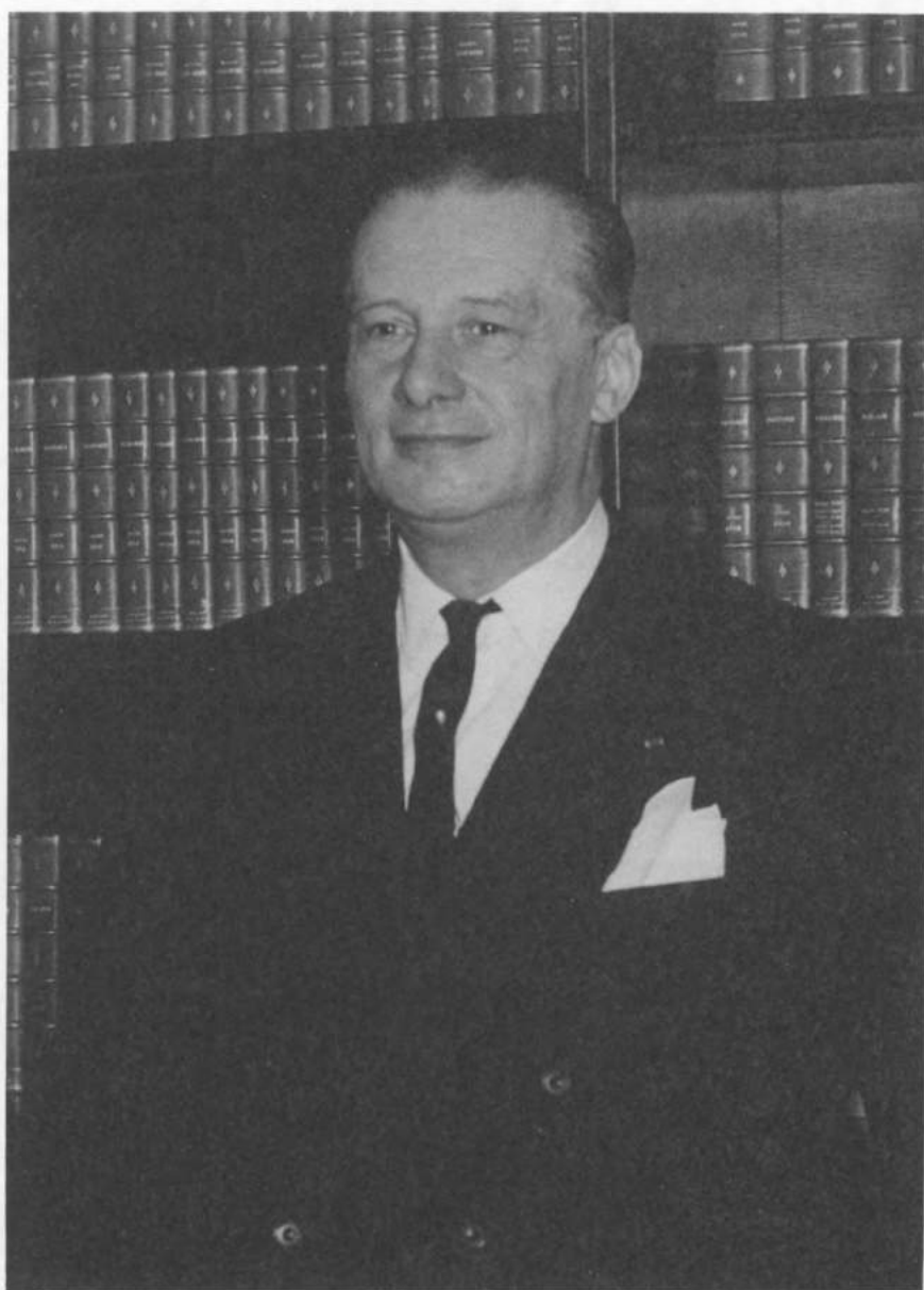
Baron Pierre WIGNY (Liège, 18 avril 1905 - Bruxelles, 21 septembre 1986)