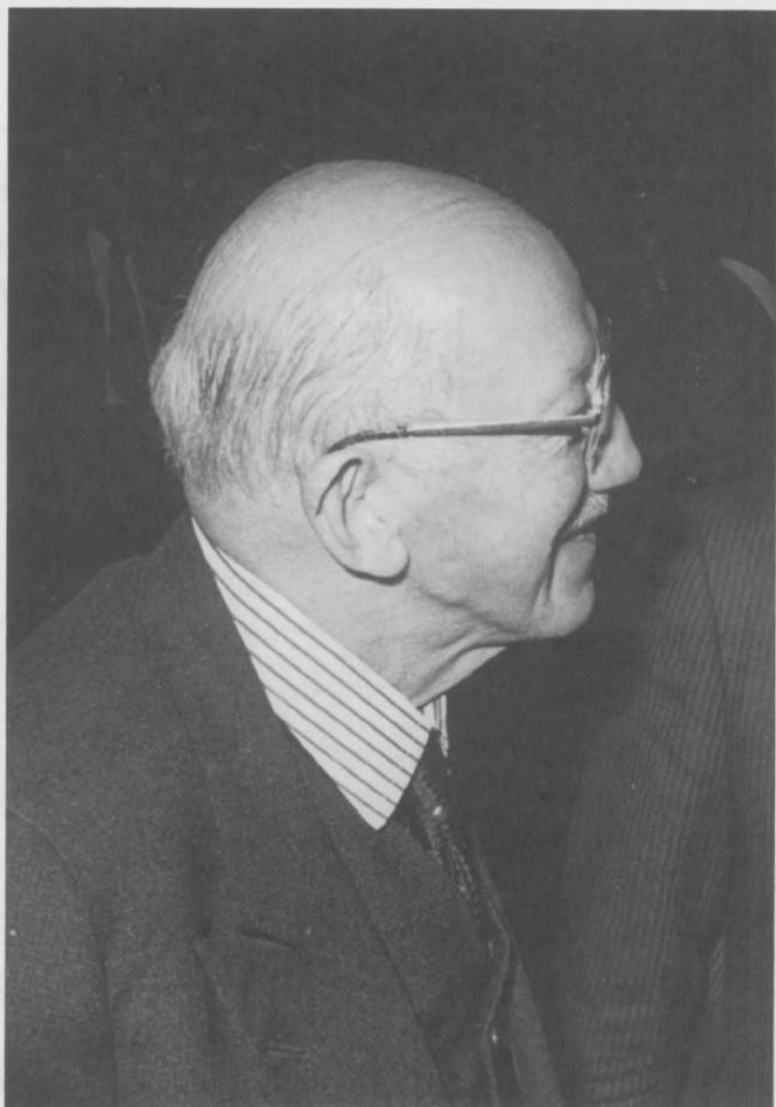
Albert CLERFAYT (Mons, 6 janvier 1900 — Bruxelles, 13 décembre 1990)