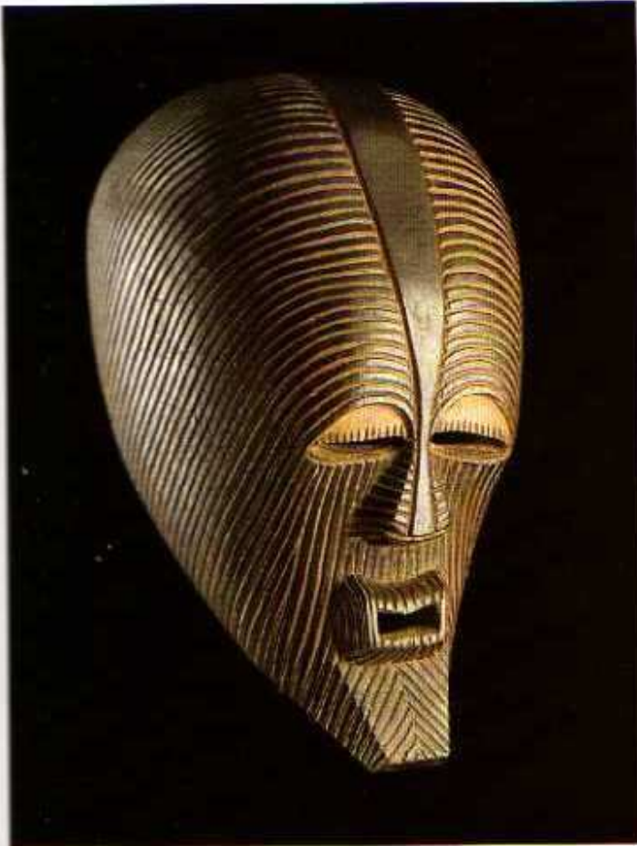
1 Masque Kifwebe. Hauteur 321 mm. MRAC, Tervuren: 20768, acquis en 1971.