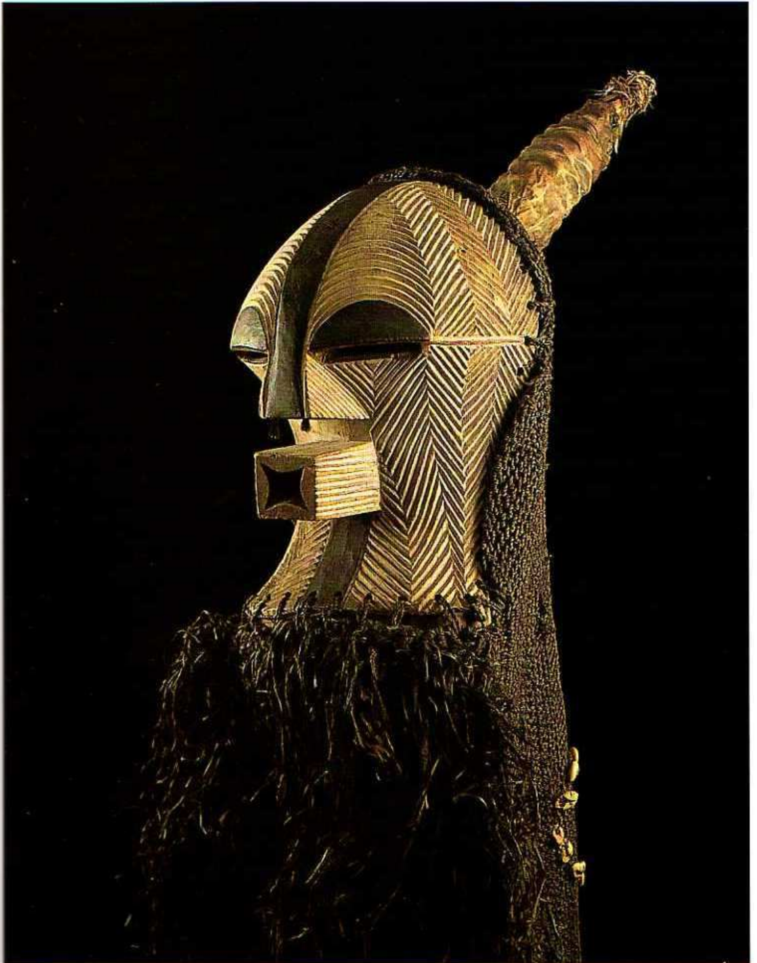
3 Masque Kifwebe, Songye/Luba. Hauteur 350 mm. Récolté avant 1934 dans la région de Katombe, Territoire de Kabalo, MRAC, Tervuren: 35652.