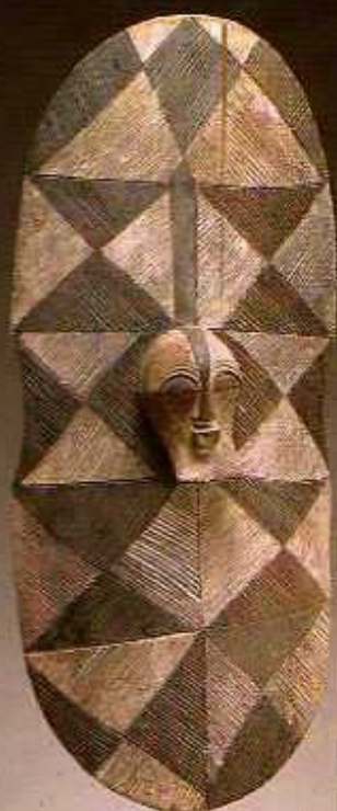
10 Bouclier avec l'image d'un masque Kifwebe, Songye. Hauteur: 660 mm. Collection Jan Elsen, Bruxelles.