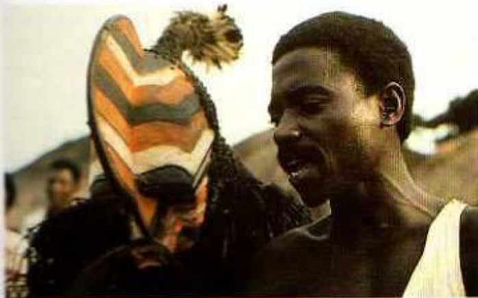
2 Kifwebe, danseur masque «cadet» avec le danseur principal. Village Kikomo, Chefferie Kiloshi, Songye orientaux. Photo de l'auteur, 1978.

collection privée R. Vanderstraete, Lasnes). Contrastant avec cette sobriété, il existe un grand nombre de masques polychromes dont beaucoup présentent une surface rayée couverte de pigments rouges, blancs et noirs; d'autres ont le visage entièrement blanchi et les traits colorés. Le premier type, aux stries tricolores, est de loin le plus varié au niveau de la forme; il est caractérisé par des éléments proéminents: une bouche, des yeux et une excroissance pointue sur le crâne ou, plus souvent, une crête sagittale.