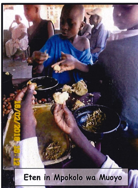
Eten in Mpokolo wa Muoyo