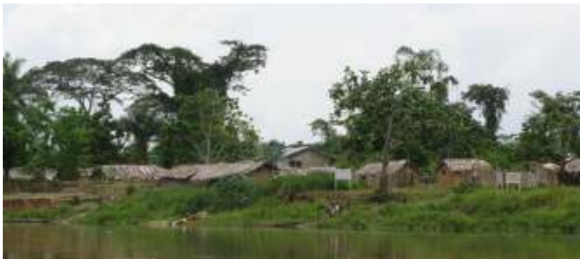
Het dorp Puku aan de stroom met de school op de achter- grond: de school voorzien van een waterput en zonnepa- nelen bevordert de ontwikkeling van het hele dorp.