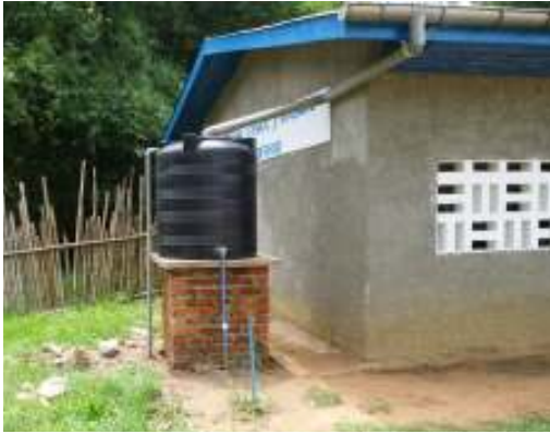
Dakgoten met tank voor de opvang van het water.