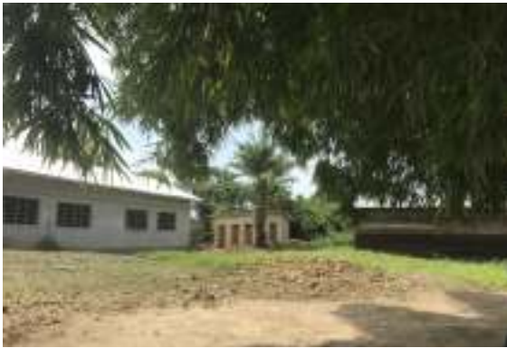
School met toiletten en varkensstal.